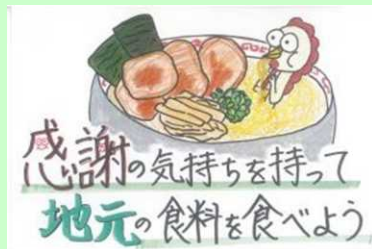
笠岡西中1年 長安 愛真