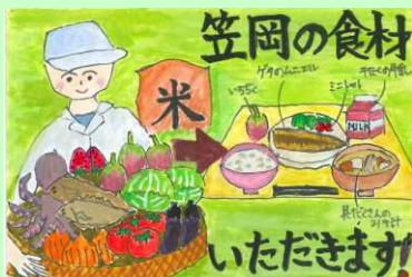
中央小6年 坂本 有紀奈